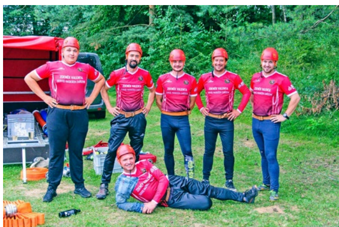
33. ročník o pohár Starosty SDH Tučapy UH 30. 6. 2024, muži obsadili 12. místo z 16 mužstev