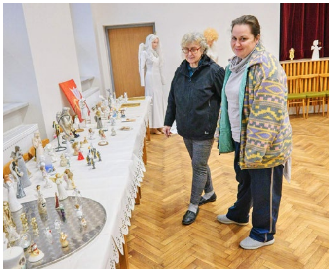
Výstava betlémů a andělů