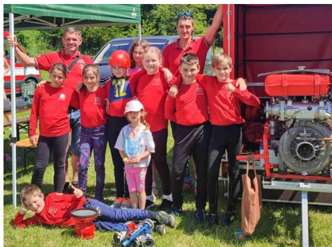
18. 5. 2024 – Ostrožská Lhota Plamen Soptíci získali 5. místo z 12. družstev