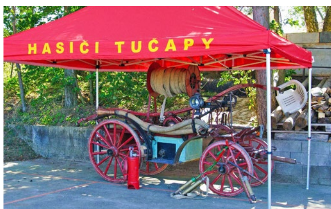
21. 9. 2024 – Oslavy 105 let od založení sboru