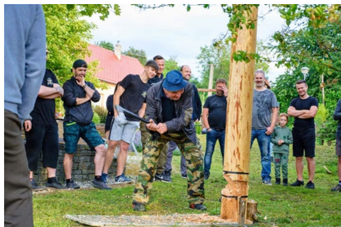
31. 5. 2024 – Kácení máje