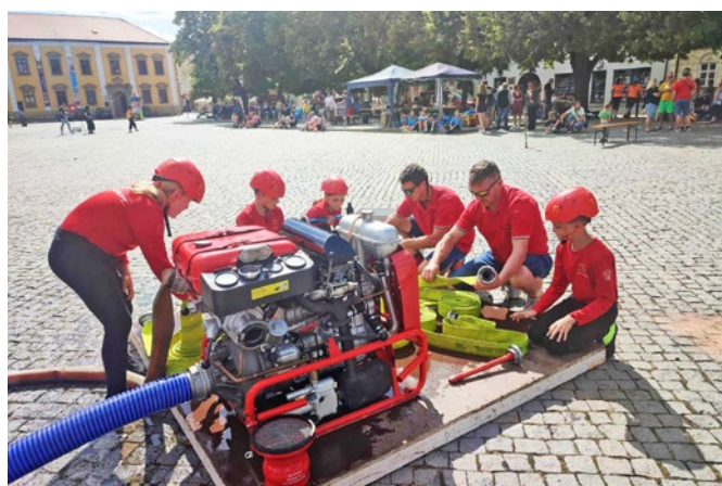
22. 6. 2024 – Soptíci Uherské Hradiště Celkové umístění v okrese UH 6. místo z 13