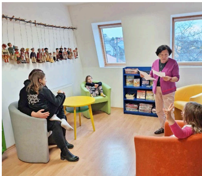
Čtenářské středky v knihovně