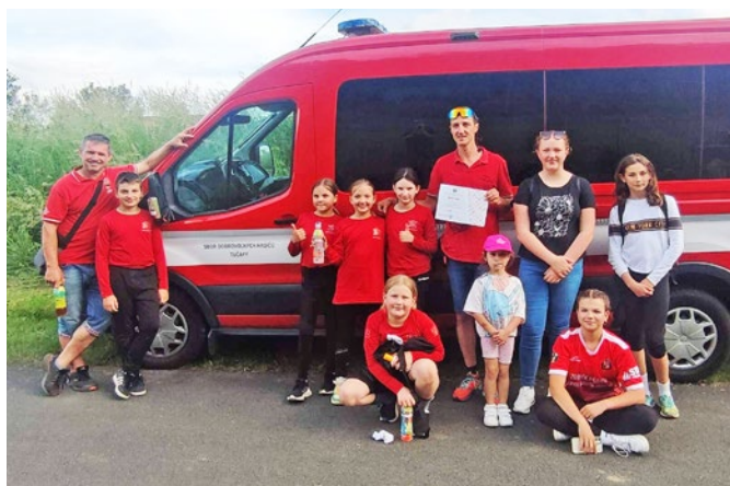
25. 5. 2024 – Soptíci v Šumicích Soptíci získali 5. místo z 12. družstev