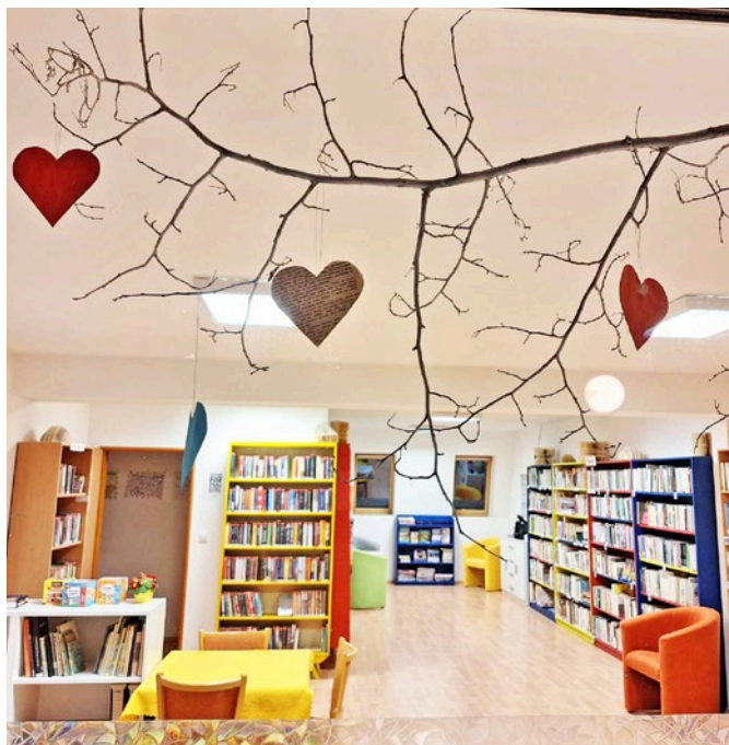
Svatý Valentýn v knihovně