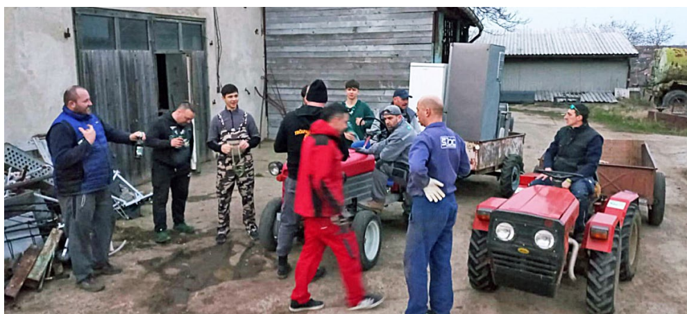
15. 3. 2024 – Sběr kovového odpadu