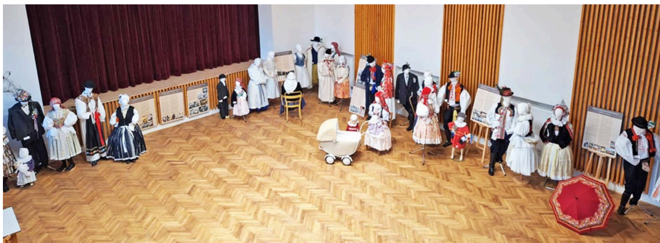
Výstava krojové inspirace napříč krajem