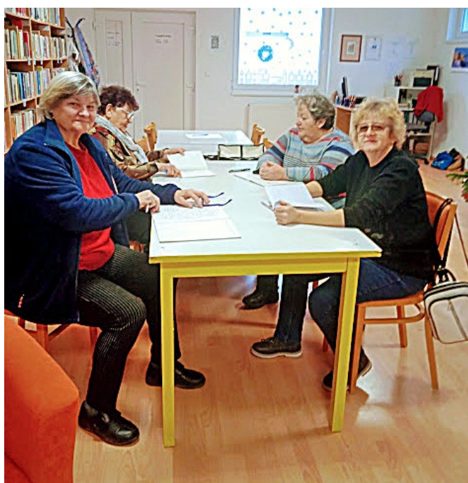
Studentky univerzity třetího věku