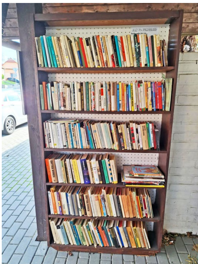
Knihobudka na autobusové zastávce