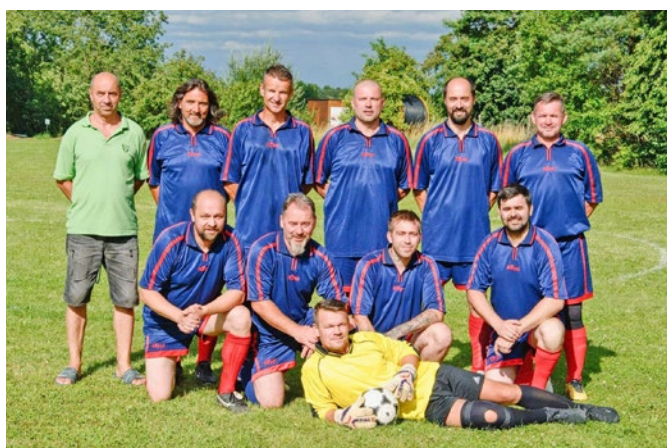
5. 7. 2024 – Fotbalový zápas ženatí versus svobodní