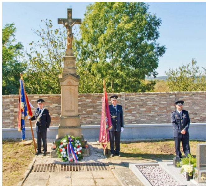
21. 9. 2024 – Oslavy 105 let od založení sboru