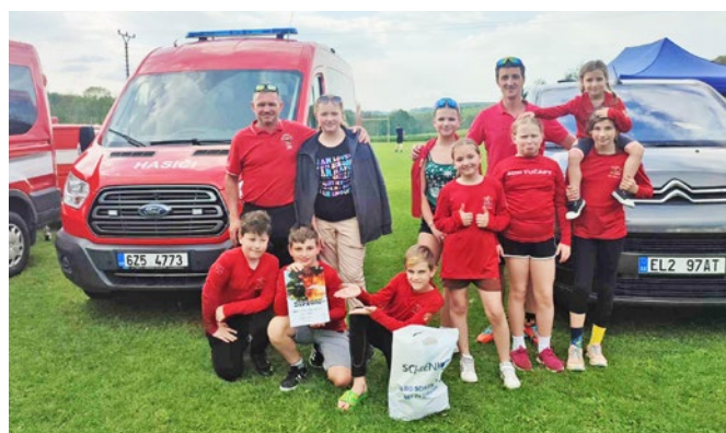
5. 5. 2024 – Soutěž mladých hasičů v Bojkovicích. Soptíci získali 4. místo z 12. družstev