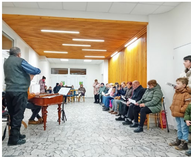
Zpívání u betléma