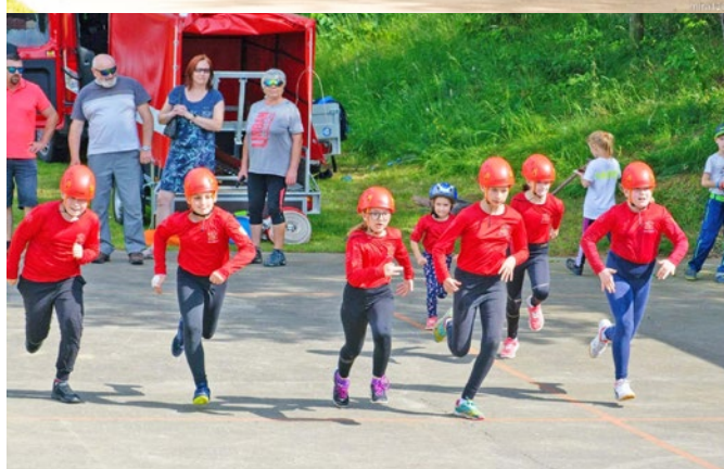
26. 5. 2024 – Okrsková soutěž SDH Tučapy