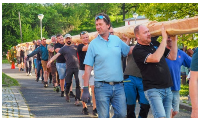
30. 4. 2024 – Stavění máje