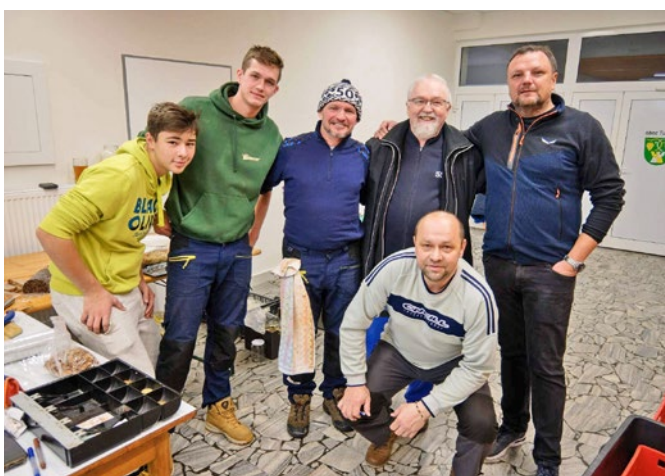
7. 12. 2024 – Hasičská zabijačka