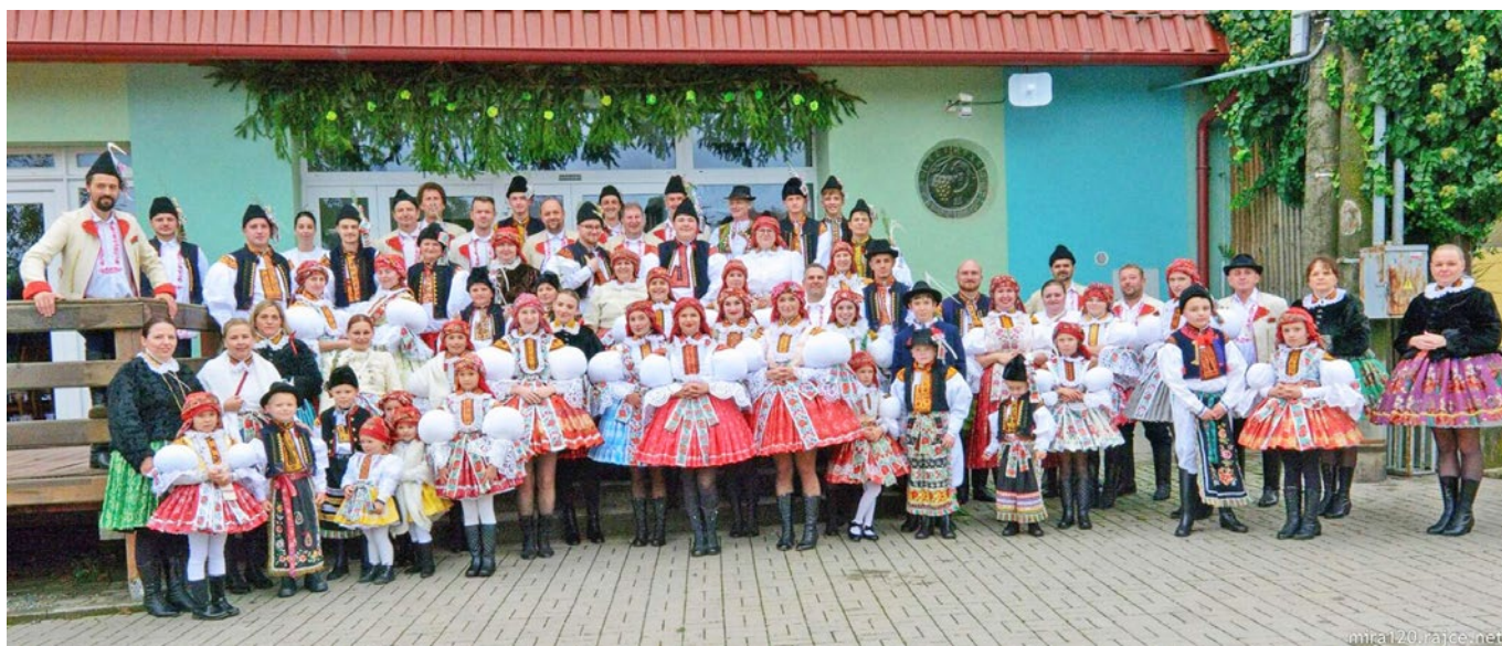
5. 10. 2024 – Slováké hody s právem