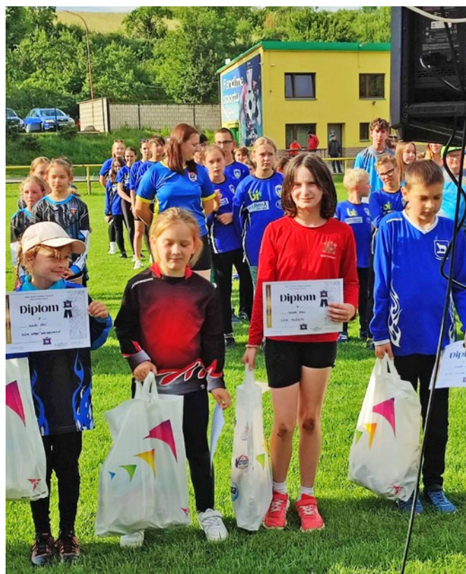
1. 6. 2024 – Soptíci Ostrožská Lhota Soptíci získali 6. místo z 14. družstev