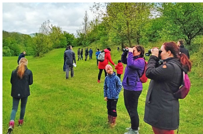
Ukázka odchytu a kroužkování ptáků