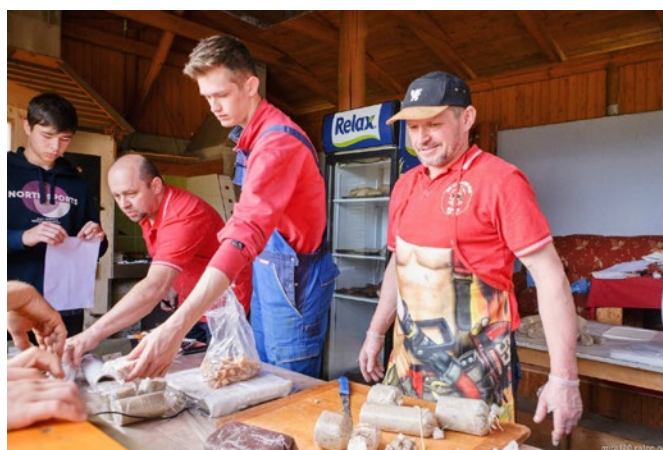
6. 4. 2024 – Hasičská zabijačka