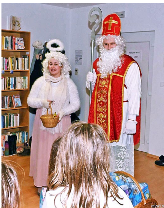
Mikulášská nadílka v knihovně