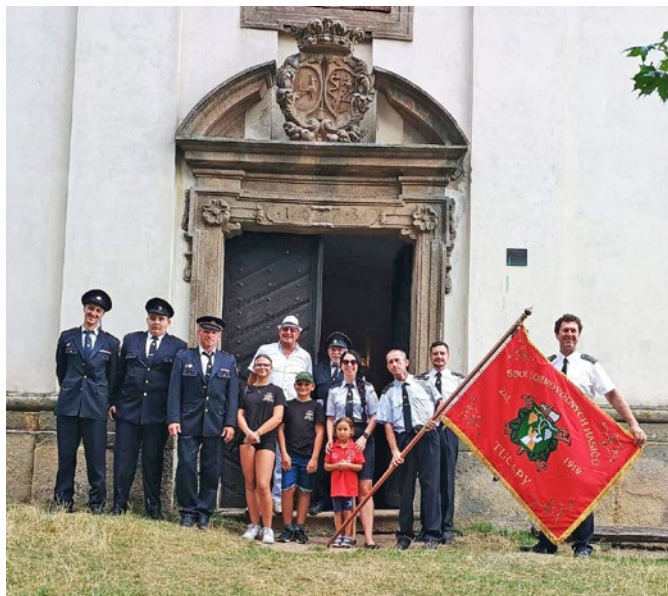
18. 8. 2024 – Mše svatá na Barborce