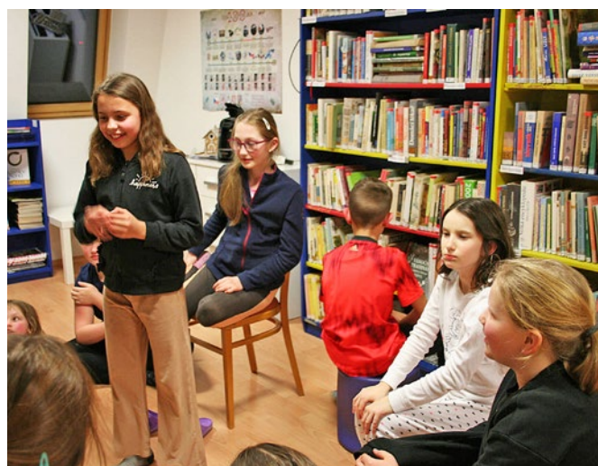
Noc s Andersenem v knihovně