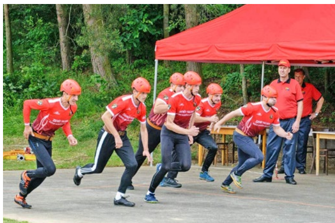
2. 6. 2024 – Okresní soutěž družstev