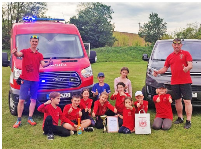
11. 5. 2024 – Soutěž mladých hasičů v Bílovicích Soptíci získali 3. místo z 16. družstev