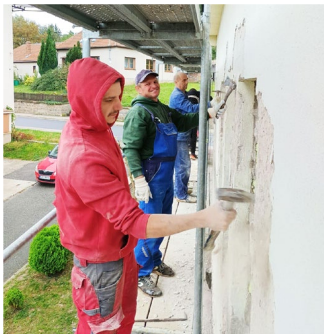
Oklepávání omítky a úklid při rekonstrukci místního kostela v Tučapech