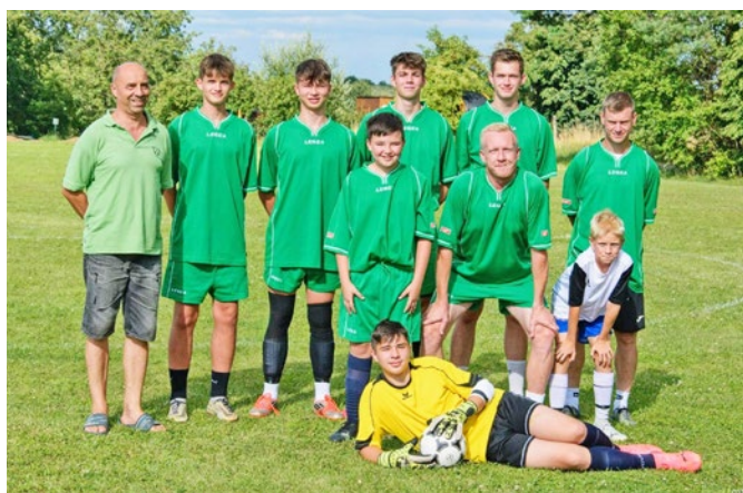
Svobodní mládenci vyhráli 3:1